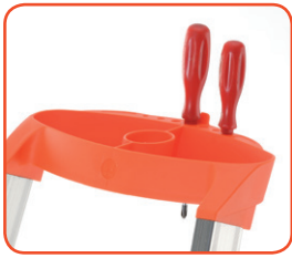
Comoda vaschetta porta-oggetti Large useful tooltray