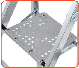
Piattaforma in alluminio (260x260 mm) con struttura rinforzata Aluminium platform with reinforced structure