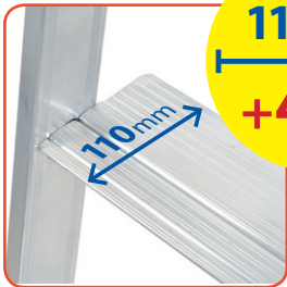
Gradino zigrinato da 110 mm, più largo, più comodo, con profilo anti-taglio, fissato tramite ribadatura 110 mm with knurled step, with rounded profile, great comfort during use