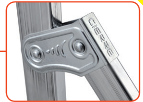
Nuova articolazione, in acciaio zincato con nervature di rinforzo Steel hinge, new design