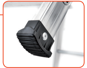
Piedini antiscivolo zigrinati, fissati ai montanti, massima aderenza al terreno Non-slip knurled feet, blocked to the upright, high grip