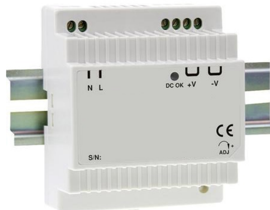
Bisheriges Hutschiene-Netzteil VNZT80191